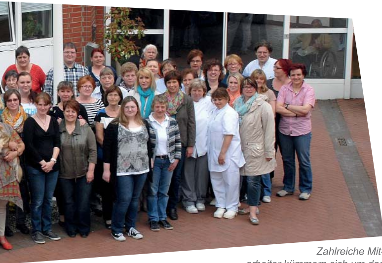
Zahlreiche Mitarbeiter kümmern sich um das Wohlergehen der Bewohner.

für die 92 Einzel- und 23 Doppelzimmer zur Verfügung stehen. Die gesetzliche Vorgabe – 80 Prozent Einzelzimmer und konsequente Barrierefreiheit – ist damit erfüllt. 1997 wurde der heute als „Oase“ bezeichnete Wohnbereich für demenziell veränderte Menschen geschaffen, die einen besonderen Betreuungsbedarf haben.