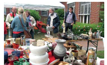
Buntes Treiben bei der Jubiläumsfeier im Caritashaus Hildegundis.

Das Caritashaus Hildegundis von Meer wurde durch den Rhein-Kreis Neuss erbaut und nach Fertigstellung im Jahr 1988 an den Caritasverband