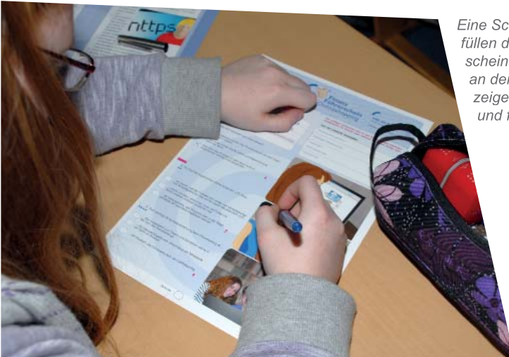
Eine Schülerin beim Ausfüllen des „Finanzführerscheins“. Die Zehntklässler an der Realschule Jüchen zeigen sich gut informiert und fragen kritisch nach.