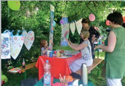
Viel Spaß hatten die Gäste bei der Gestaltung eines Familienwappens.

Das Sommerfest im Ons Zentrum am 6. Juli stand unter dem Motto der Caritas Jahreskampagne „Familie schaffen wir nur gemeinsam“. Über 300 Besucher genossen einige fröhliche Stunden. Ihre kreative Seite konnten die Gäste zum Beispiel bei der Gestaltung eines „Familienwappens“ ausleben. Trotz der sommerlichen Wärme waren einige Familienteams aktiv beim Beachvolleyball. Beliebt waren auch Spiele mit dem Schwungtuch sowie natürlich die Schminkaktionen.