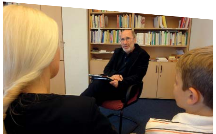
Im Beratungsgespräch werden familiäre Konflikte ergründet und gelöst.

Ein qualifiziertes Team von Sozialarbeitern, Sozialpädagogen und Psychologen leistet Hilfe und Unterstützung bei Erziehungsproblemen oder Konflikten, die Kinder, Familien oder Jugendliche betreffen. Zum Angebot gehören z.B. Familientherapie, Workshops in Schulklassen oder therapeutische Kindergruppen.