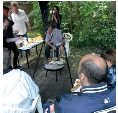
Samstags-Grillen bei FaKt und Frau-Ke

Viele Besucher von FaKt und Frau-Ke nutzen die Einrichtung regelmäßig als Treffpunkt. Dabei geht es weniger um Beratung, sondern mehr um Kontakte und Gespräche mit anderen Menschen in ähnlicher Situation. Seit Februar 2012 tragen die Einrichtungen diesem Wunsch Rechnung und öffnen immer am letzten Samstag im Monat von 9 bis 13 Uhr. Mittlerweile nutzen diesen zusätzlichen Tag bis zu dreißig Besucher. Da der ALG II-Satz am Ende des Monats in der Regel aufgebraucht ist, gibt es immer ein kostenfreies Mittagessen für jeden Besucher. Manchmal wird auch gegrillt.