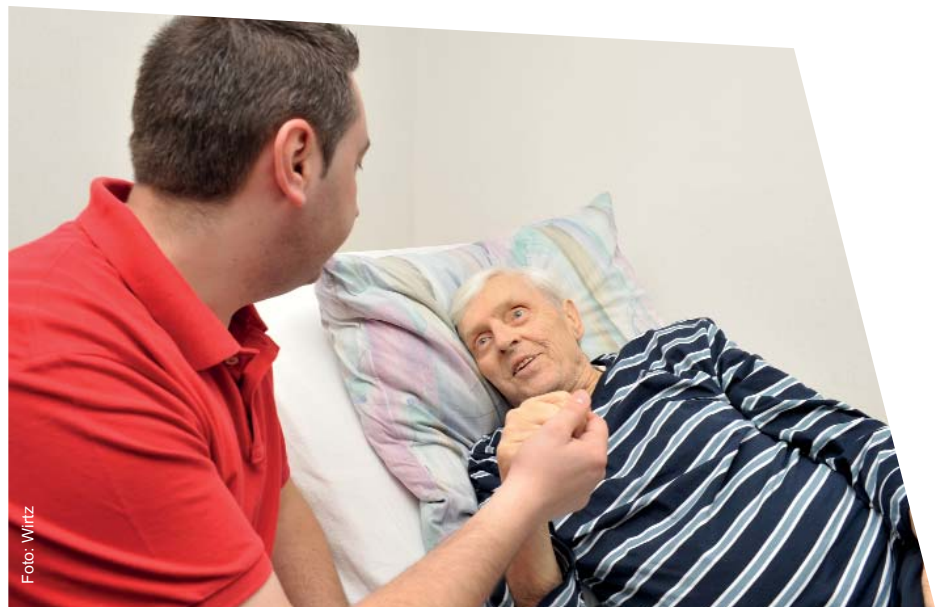
Begleitung auf dem letzten Weg: Palliativpflege ist mehr als nur Pflege. Sie hat auch einen seelsorgerischen Aspekt.

Neben der pflegepraktischen Seite hat die Palliativpflege einen seelsorgerischen