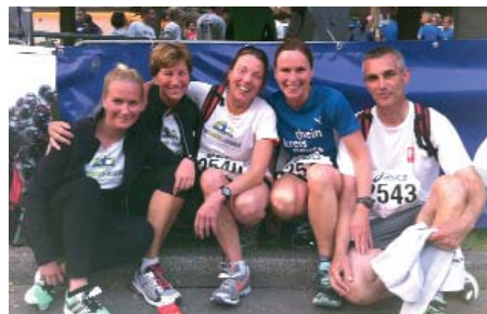
Spaß am gemeinsamen Laufen: das Caritas-Team beim Sommernachtslauf

Wie schon 2012 nahmen Mitarbeiterinnen der Fachambulanz für Suchtkranke erfolgreich am 31. Neusser Sommernachtslauf teil. Bei Superstimmung, begeisterten Zuschauern und bestem Wetter stand der Spaß am gemeinsamen Laufen im Mittelpunkt. Das Caritas-Team freut sich über Verstärkung, um 2014 wieder als Mannschaft der Caritas an den Start zu gehen. Interessierte Hobbyläufer können sich melden unter Tel. 02131/889-170.