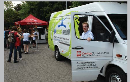
Das PrEvent-Mobil im Einsatz.

Das Präventionskonzept setzt vor Ort und konkret beim Konsum junger Menschen an. Ziel ist es u.a., das Bewusstsein