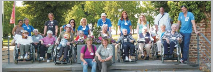
Ausflügler und Betreuer beim Gruppenbild nach einem unvergesslichen Tag in Schloss Dyck.

Zehn Bewohner des Caritashaus St. Theresienheim erlebten am 6. Juni einen unvergesslichen Tag im Park von Schloss Dyck in Jüchen. Möglich wurde der Ausflug durch ein Angebot der De Lage Landen Leasing GmbH aus Düsseldorf. Das niederländische Unternehmen stellt sein Personal an zwei Tagen im Jahr von der Arbeit frei, um sich sozial engagieren zu können. Nach einem leckeren Essen im Schatten der Sonnenschirme durchstreiften einige Ausflügler den Park, andere schauten sich das renovierte Schloss mit seiner Fotoausstellung an.